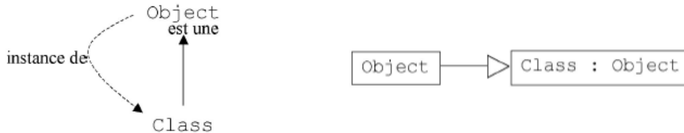
Schéma objet méta-circulaire